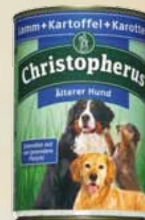
Älterer Hund Lamm+Kartoffeln+Karotten