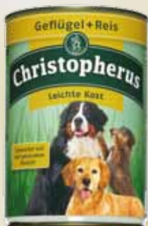
Leichte Kost Geflügel+Reis