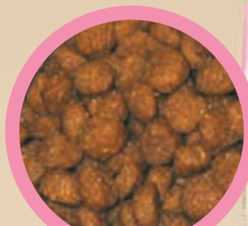
2. - 12. Monat

Die Krokettengröße ist auf die Proportionen von jungen Katzen abgestimmt und erleichtert die Nahrungsaufnahme