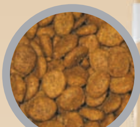
ab 8. Lebensjahr

Die Form und Beschaffenheit der Kroketten ist ideal für Zähne älterer Katzen