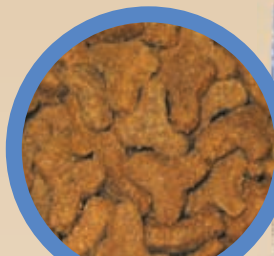
2. - 8. Lebensjahr

Die Krokettengröße und -struktur erleichtert die Aufnahme und das Kauen der Nahrung